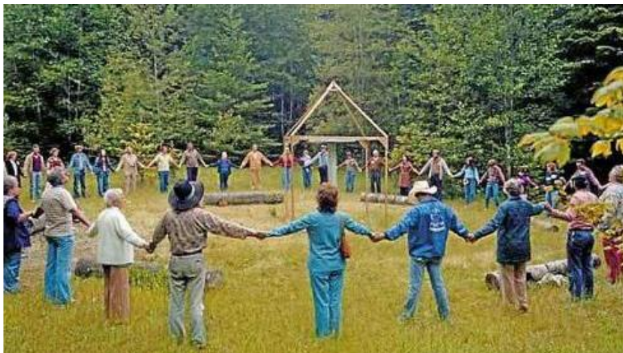
Un raduno di seguaci del neopaganesimo: forte l'interazione con la natura